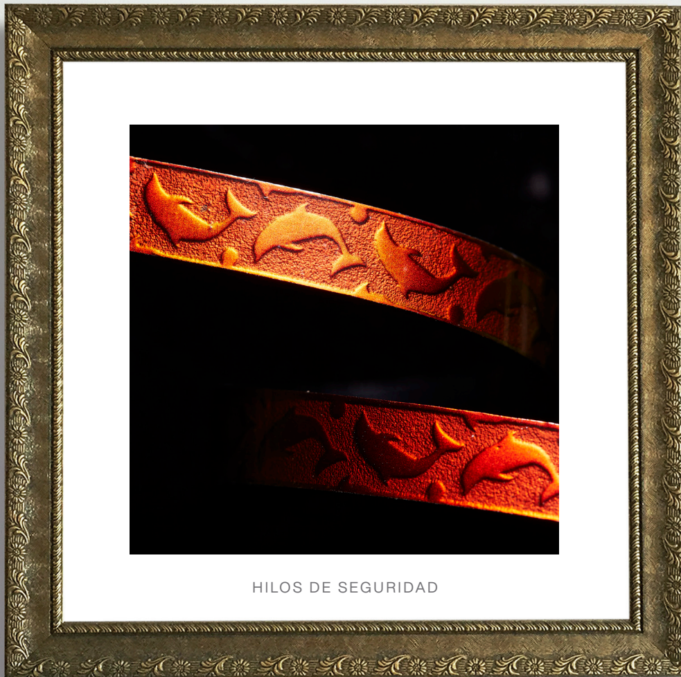
HILOS DE SEGURIDAD

Oberthur Fiduciaire (Paris 1942) Titulo Relief™ c.2021-2022